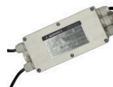
Caja SUMA ABS