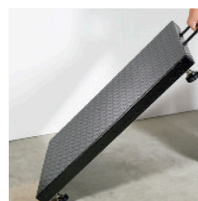
Asa para su transporte