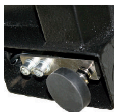
Pies regulables y célula de acero niquelado IP66